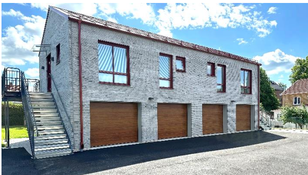
Borgmästaregatan 8 C-D.

Intresse, maila till info@johanssonsfastigheter.se , och skriv i ämnesraden: C-101.